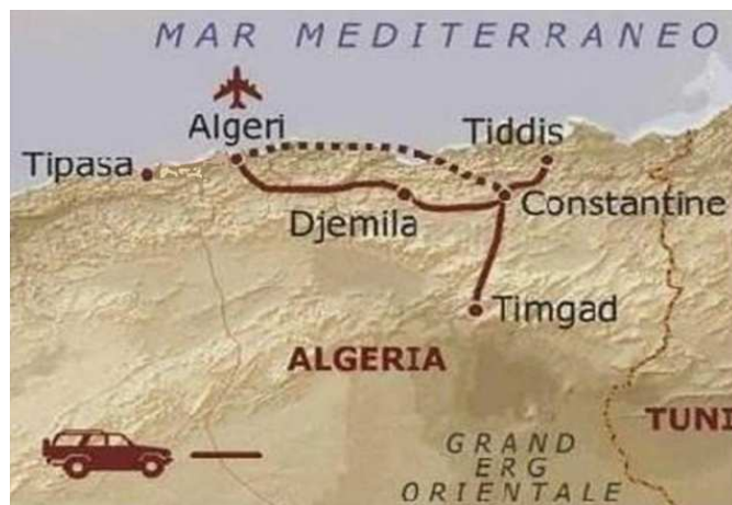
ITINERARIO PARTE ARCHEOLOGICA